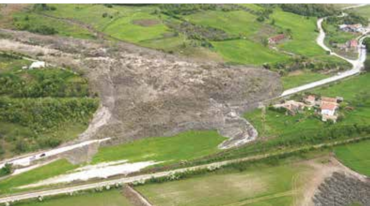
1. La frana di Montaguto (AV) avvenuta nel 2006

Il fenomeno risultava particolarmente complesso sia per l'aspetto dimensionale (lunghezza di 3.000 m, superficie di oltre 670.000 m 2 e volume superiore ai 6.000.000 di m 3 ) che per quello cinematico-evolutivo. Nei lavori previsti rientra una serie di interventi di canalizzazione fuori dalla frana delle acque dei laghi e delle sorgenti presenti lungo il corpo di frana.