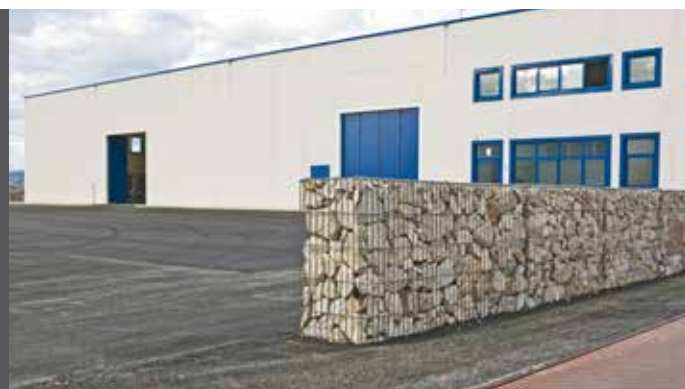
6. Lo stabilimento di produzione di reti a Sturno (AV)

La produzione avviene prettamente in Italia e si caratterizza di innovazione ad altissima qualità che segue le esigenze del mercato internazionale e le certificazioni imposte dalla Comunità Europea, cercando di soddisfare le esigenze della Clientela anche attraverso un'assistenza commerciale su tutto il territorio grazie alla rete di Tecnici ed Agenti in ogni regione e a un servizio rapido ed efficiente con depositi dislocati al Nord, Centro, Sud e isole. In entrambi i settori le punte di diamante sono la produzione di reti e di pali e di una gamma dedicata alla realizzazione delle opere attraverso sinergie con Produttori di accessori in modo da offrire agli operatori tutti i prodotti. Per il settore idrogeologico, la Società sta attualmente ampliando e perfezionando