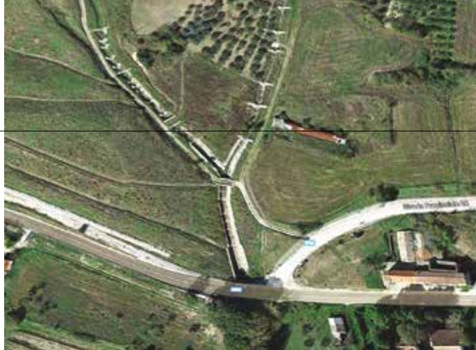
2. L'area interessata dagli interventi di canalizzazione