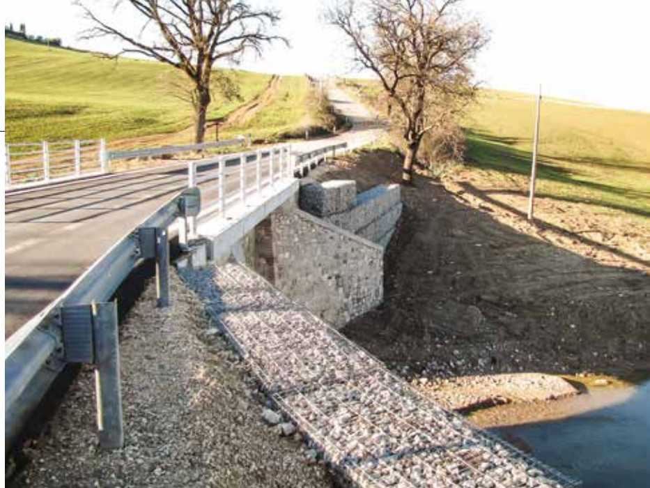
5. I gabbioni rigidi IRPIDbox