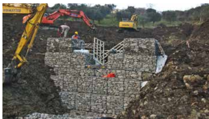
3A, 3B, 3C e 3D. Alcune fasi dell'esecuzione dei lavori